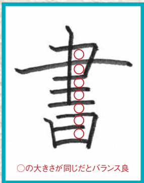
○の大きさが同じだとバランス良

横線のある文字の場合は、できる限り間隔を均等にすると美しくなります。姿勢を良くして顔を紙から離せば、文字の全体像が見えて等間隔の線が引けるようになります。