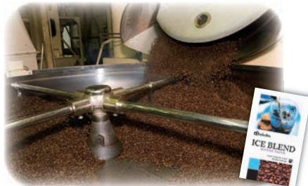
自社焙煎のダイオースのコーヒー

編集部▶ガムシロップとゼラチンを入れてゼリーはいかが? また、今号のBREAK TIMEを参考にしてみてください。